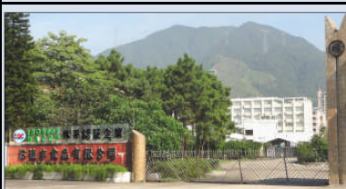
松徳豊食品有限公司