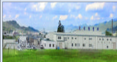
丸松物産(株)山形工場

今後、より一層の強化を図り管理態勢の維持・発展を目指して参りますので、引き続き弊社製品のご愛顧賜ります様、宜しく願い申し上げます。