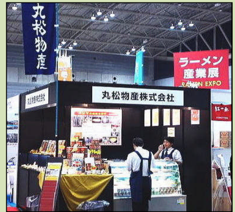
2010年(第5回)ラーメン産業展の弊社ブース