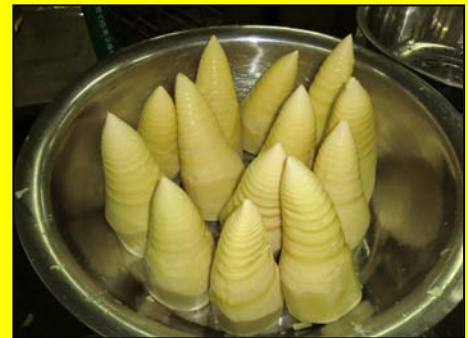
入荷処理が施された麻筍

従って、今年の新物価格は、昨年価格より上がる見通しとなっており、弊社としては今後の相場動向に注意して参りたいと考えます。