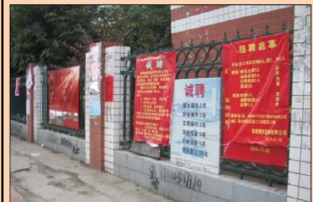
※福建省における工場団地での人材募集

中国の沿岸地域では、その募集が工場団地ということもあって、待遇条件の内容が良い工場などがすぐわかり、目移りし易い環境にもあることから、今の中国における労働者はまさに引っ張りだこのようです。