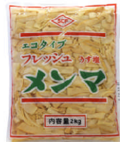
エコタイプフレッシュうす塩メンマ 2kg

弊社中国工場製造品。塩抜きに必要な時間、水の節約が出来、しかも風味、歯ごたえも塩メンマと同等です。