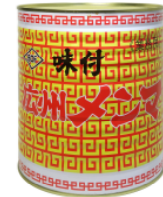
味付広州メンマ 1号缶