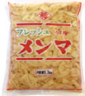
フレッシュうす塩メンマ 1.7kg

塩抜きに必要な時間、水の節約が出来、しかも風味、歯ごたえも、従来の塩メンマと同等です。