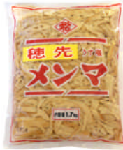
穂先うす塩メンマ 1.7kg

塩抜きに必要な時間、水の節約が出来、しかも風味、歯ごたえも、従来の塩メンマと同等です。