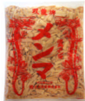
双龍牌 細切メンマ 2kg

弊社中国工場製造品。塩抜きに必要な時間、水の節約が出来、しかも風味、歯ごたえも塩メンマと同等です。