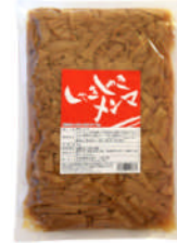
しゃきしゃきメンマ