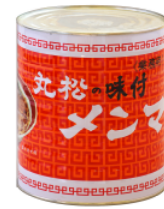
丸松の味付メンマ 1号缶